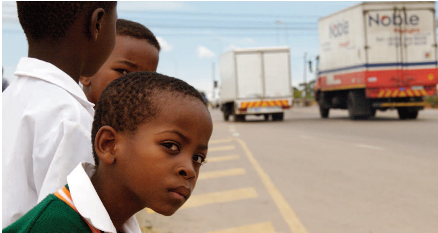
Schlimme Aussichten: Weil zu wenig für Verkehrssicherheit getan wird, müssen Millionen Kinder sterben.

Die Commission for Global Road Safety spricht von einer «schleichenden Epidemie». Als Teil der Weltbank fordert sie einen globalen Aktionsplan. Wie dringend nötig das ist, zeigt auch eine Studie, welche RoadCross aufgrund der Zahlen von Weltbank und Weltgesundheitsorganisation (WHO) erstellt hat: In 10 bis 15 Jahren werden die Verkehrsunfälle die drittgrösste Epidemie sein, mit mehr als zwei Millionen Toten und gegen 50 Millionen Schwerverletzten jährlich. Zum Vergleich: In allen kriegerischen Auseinandersetzungen werden pro Jahr 330'000 Menschen getötet. Schlimm ge-