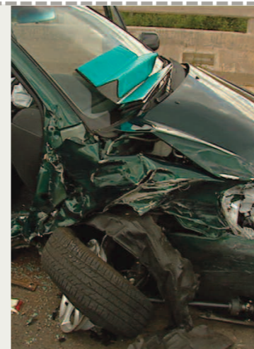
Böse Folgen: Der Traum vom eigenen Auto führt in Osteuropa zu stark steigenden Unfallzahlen.

neuen EU-Staaten leistet. Doch angesichts der hohen Kosten der Verkehrsunfälle in Polen – 9 Milliarden Franken pro Jahr! – ist dieser Beitrag in nur zwei Wochen verbraucht. RoadCross verlangt deshalb, dass 1 Prozent der Schweizer Beiträge in den neuen EU-Staaten für Prävention eingesetzt wird. Denn mit gezielten Massnahmen, wie sie RoadCross in der Schweiz zum Beispiel erfolgreich in Schulen und Lehrstätten durchführt, kann viel Leid vermieden und langfristig viel Geld gespart werden. Auch im Kosovo. Hier steigt die Zahl der Toten und Verletzten im Strassenverkehr ebenfalls. Und die Situation wird