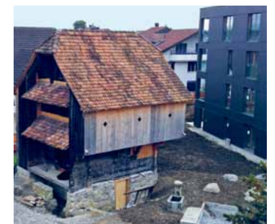
Bereits restauriert: Spycher, erbaut 1743.

Die biedermeierliche Überformung im 19. Jahrhundert gab dem Bauernhaus ein uneinheitliches Erscheinungsbild, gehört jedoch aus denkmalpflegerischer Sicht zur Geschichte des Gebäudes. Zugunsten einer höheren Wohnqualität werden aber nun die barocken Reihenfenster rekonstruiert, welche auf die Raumaufteilung besser zugeschnitten sind. Doch sollen die Eingriffe von 1868