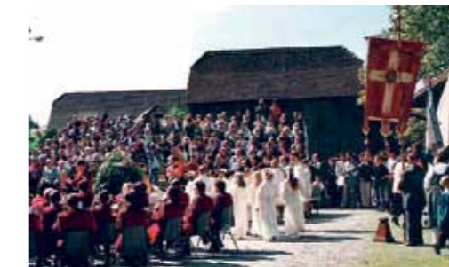
Ein Ort der Kirchfeste: Margrethenhof damals.

Unvergessen bleiben auch die vielen Jugendtheater, welche vom örtlichen Jugendverein organisiert, inszeniert und aufgeführt worden sind. Eines der Theaterstücke trug den Namen «Zmetzt dromome». Die Bedeutung des Platzes kann tatsächlich mit diesem Ausspruch auf den Punkt gebracht werden. «Zmetzt dromome» beschreibt ein Zentrum und das Leben, Wer-