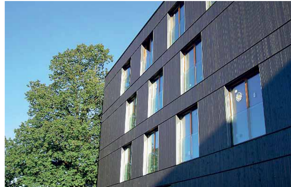
Bauen im Einklang mit der Natur: Sogar für die Bäume wurden spezielle Schutzmassnahmen getroffen.

In einem halben Jahrzehnt können sich die Möglichkeiten und Randbedingungen in Planung und Architektur stark verändern.