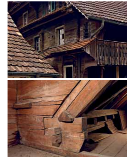
Geschichtlich und künstlerisch besonders wertvoll: Das barocke Wohnhaus. Zusammen mit dem Spycher (unten) steht es unter Denkmalschutz.