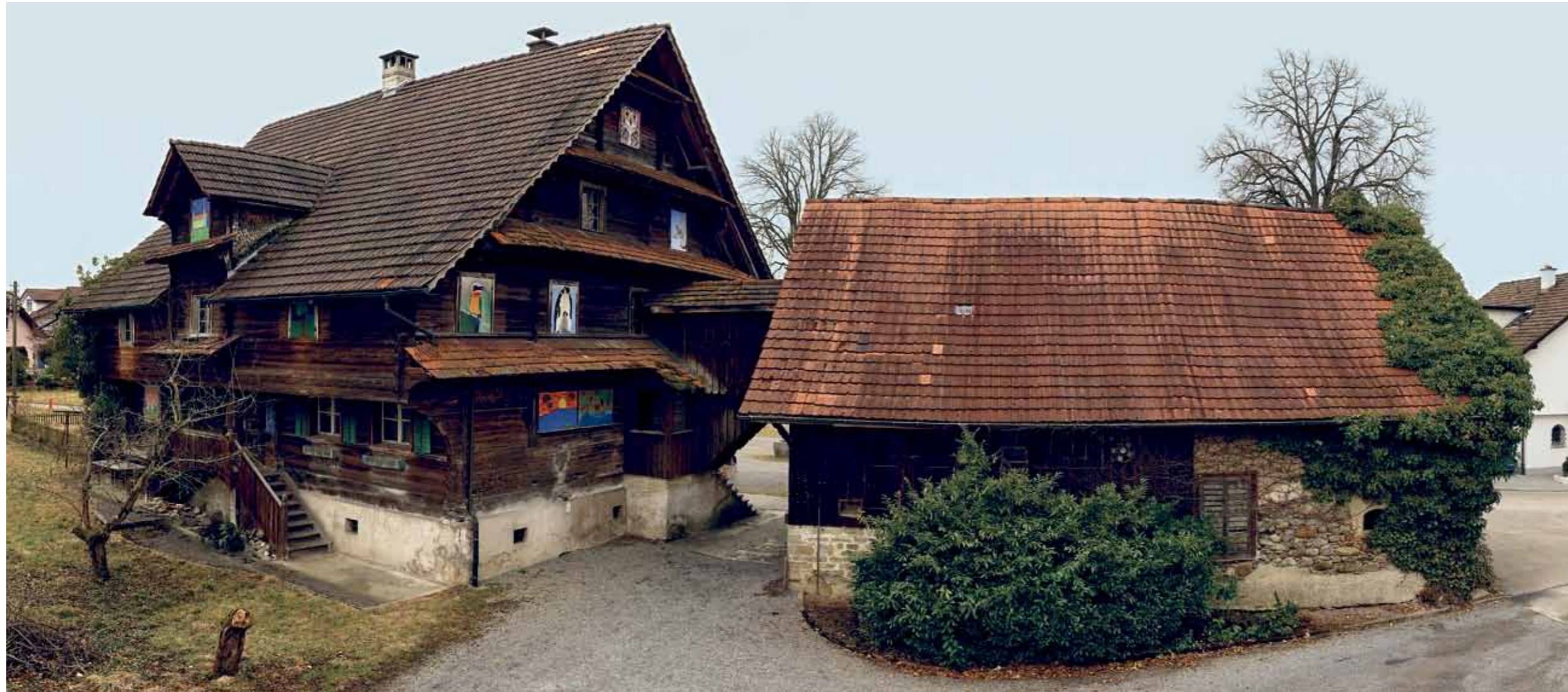
Zentrale Lage, geschichtsträchtiger Ort: Auf dem alten Margrethenhof fanden Feste und Theater statt. Lange war seine Zukunft ungewiss.